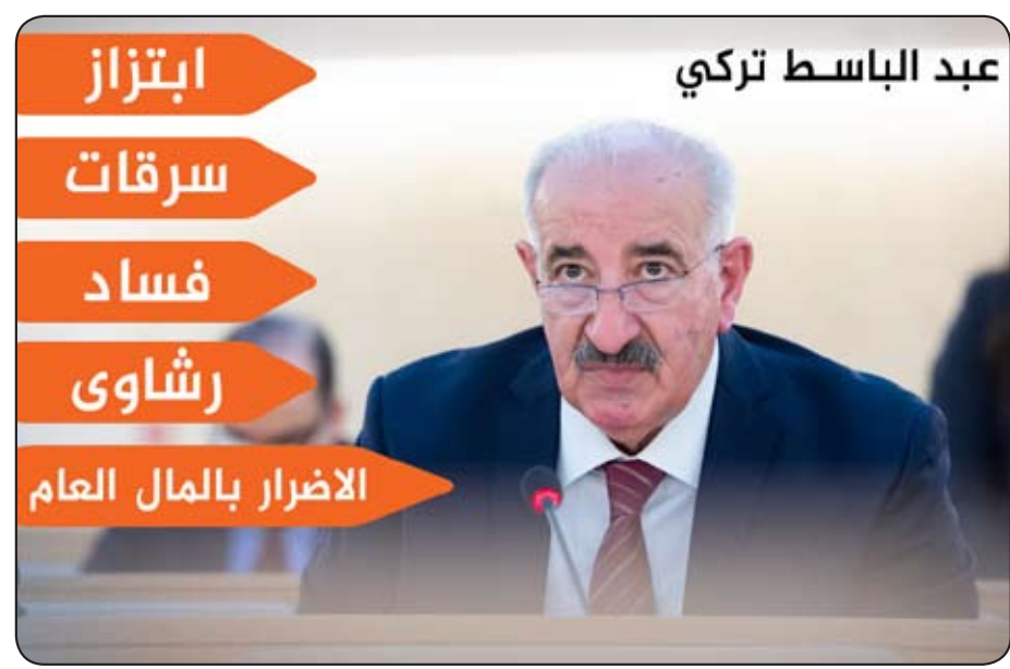
عبد الباسط تركي

النهار / بغداد قدم زعيم التيار الصدري مقتدى الصدر اعتذاره لانصاره عن انسحابه أثناء إلقاء كلمته في ذكرى اغتيال والده، مبيّناً أن الانسحاب كان "لاستمرار حياته في خدمة أنصاره وحفاظاً على سلامتهم". وقال الصدر في بيان "بكل صدق ومحبة أقول لكل من أحيا الذكرى السنوية في داخل العراق وخارجه حياكم الله والشكر لكم من الله على هذا الإخلاص والمحبة والعاطفة لصاحب الذكرى ونجليه وي: أنا العبد الفقير المحتاج لرحمة ربه.. ولأن الصدر الكرام" وأضاف الصدر "أقدم اعتذاري عن الانسحاب من بينكم أثناء إلقاء الكلمة حفاظاً على سلامتكم أولاً.. ولكي تستمر حياتي في خدمتكم ثانياً، كما لم يشأ الله أن أكون في سيارة السيد الوالد واخوتي في يوم الاستشهاد". وختم الصدر بيانه لانصاره بالقول "أسألكم الدعاء لي بنيل الشهادة لأتحقق بركبهم"، قاصداً بذلك والده وشقيقه، وطلع زعيم التيار الصدري مقتدى الصدر خطاباً وجهه إلى اتباعه بذكرى رحيل والده الذي اغتاله نظام حزب البعث في تسعينيات القرن الماضي.