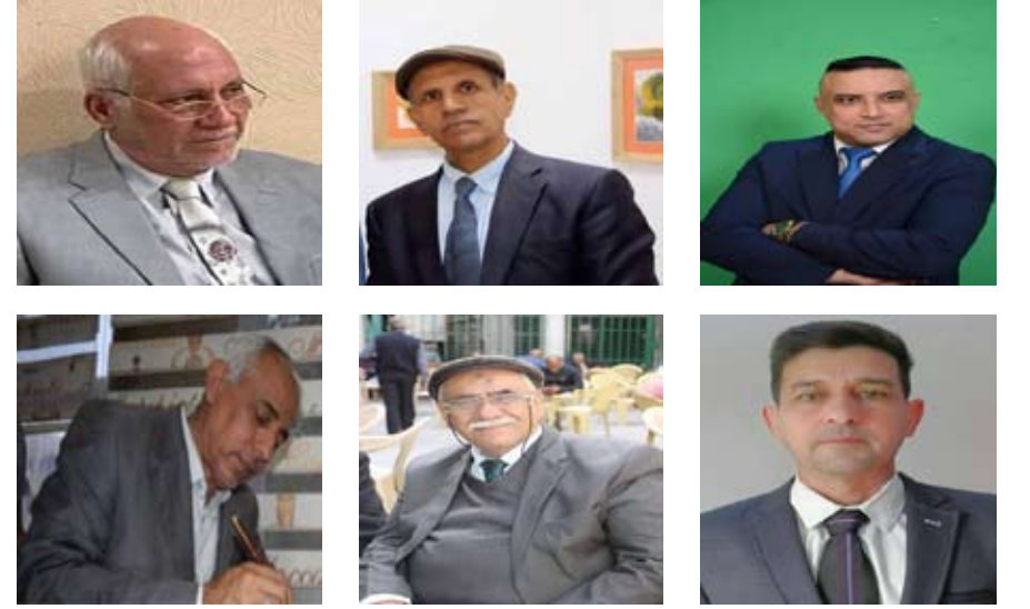
حفيق / علي صحن عبد العزيز

زمان لا تمر علينا عطلة نهاية السنة الدراسية دون الانتحاء بنشاط تعليمي أو رياضي أو العمل في الأسواق بهدف تحمل المسؤولية ومنها تجتهد لمواجهة الحياة بمختلف محاورها، ومع كثرة المغريات في هذا الزمان بات من الضروري استثمار الطاقات الطلابية وأحتوائهم لإنتسابهم من الضياع وتطوير ذاتهم وزيادة وعيهم، وتعزيز الهوية الوطنية لديهم وإنماء مواهبهم وإمكانياتهم، ومن هذا المنطلق على الجهات المسؤولة مساعدتهم بتبنيته برامج متنوعة تحفيزية لبناء شخصيتهم، جولات سياحية هدفها إكسابهم روحاً وطنية وإيماناً بواجبهم الوطني، وكذلك إقامة مهرجانات ومؤتمرات تعنى بتأهيلهم وإعدادهم للشباب، وكذلك إقامة تدريبات في جميع المجالات وتشجيع الورش التدريبية ولا ضير بمشاركة جميع المنظمات مع شريحة الشباب ومن هم دون هذا سن ولجميع الفئات العمرية، وعلى مدى سنوات القادمة لضمان مستقبل مشرق للخروج من دائرة الخطر التي تحيط بواقعنا الوطني.